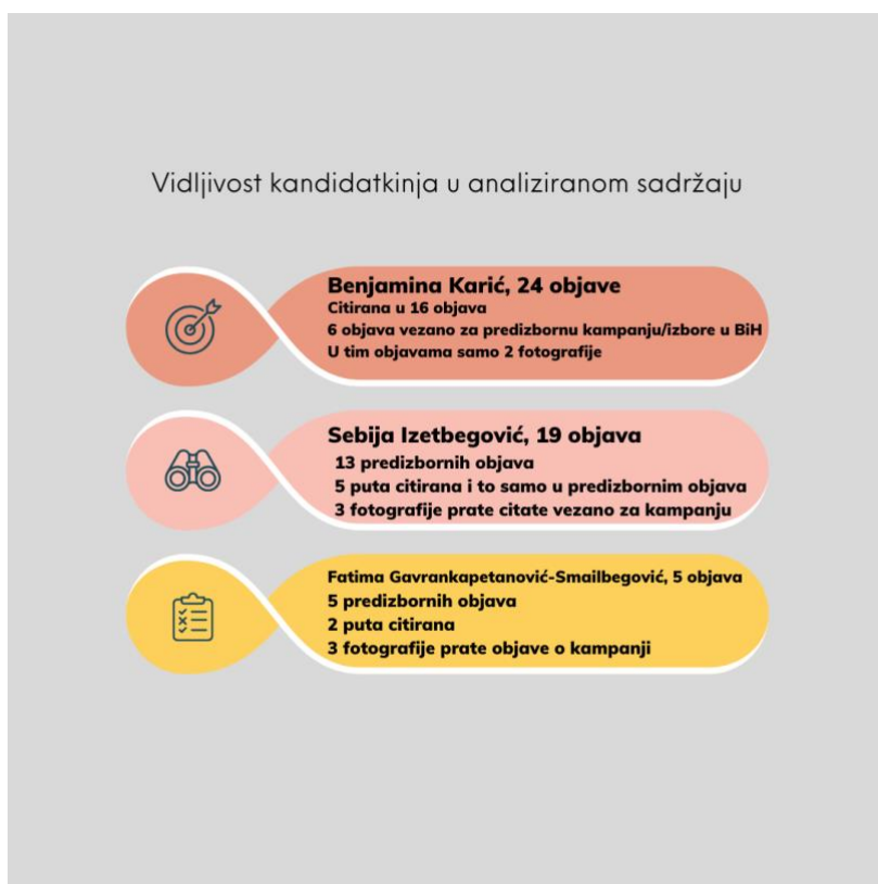
Infografika 4: Vidljivost kandidatkinja ime, fotografija i riječ