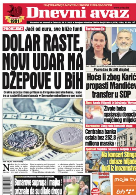
Ilustracija 1: Naslovnica Dnevnog Avaza izdanje 29.9.2022.

Od 104 analizirana izdanja samo je u jednom, i to Dnevnog avaza, naslovnica sadržavala ime i fotografiju kandidatkinje u kontekstu predizborne kampanje. Ilustrativno je da su mjesto na naslovnici u analiziranom periodu dobile druge istaknute ženske figure samo ne iz BiH, poput preminule kraljice Elizabete iz Velike Britanije.