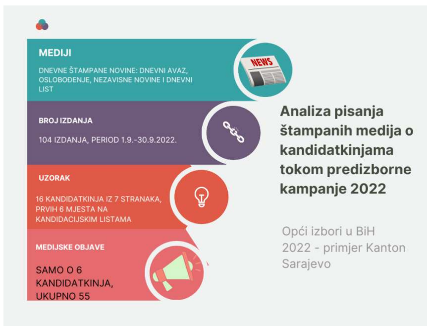
Infografika 1: Opći pregled analiziranog sadržaja

Pregledom izdanja tokom analiziranog perioda ustanovljeno je da je od 16 kandidatkinja sa prvih 6 mjesta na kandidacijskim listama za Skupštinu KS izvještavano samo o 6 u 55 medijskih objava.