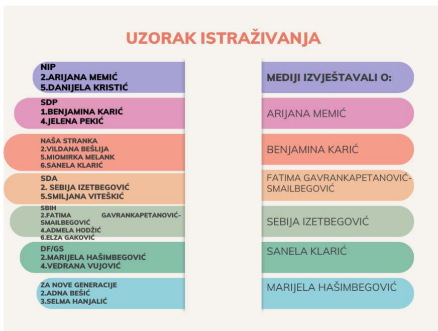
Infografika 2: Uzorak istraživanja i o kome su mediji izvještavali