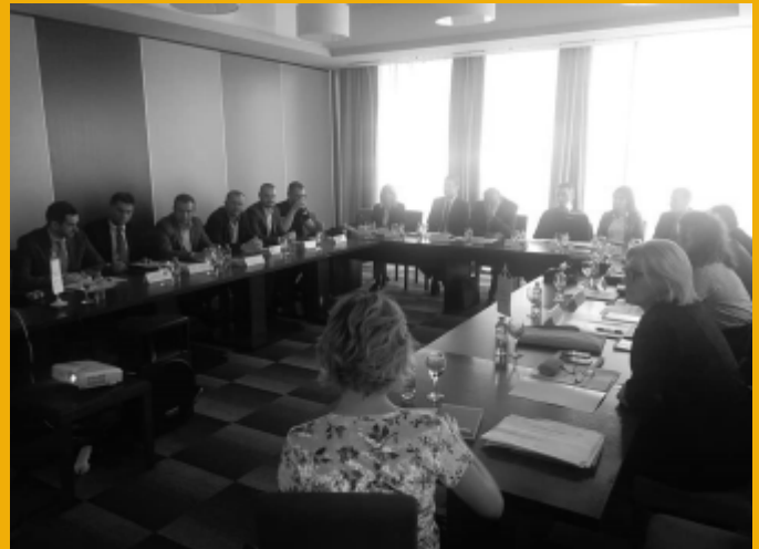
Edukativni program Account-a