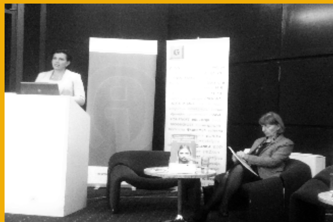
Drugi debatni forum kandidatkinja sa izbornih lista na Općim izborima, Sarajevo

Cilj projekta „Pravna pomoć kandidatkinjama na Općim izborima u oktobru 2018“ je zaštita prava žena u politici u Bosni i Hercegovini kao i povećanje pravne zaštite kandidatkinja u slučaju povrede njihovih izbornih prava, prije i poslije izbora.