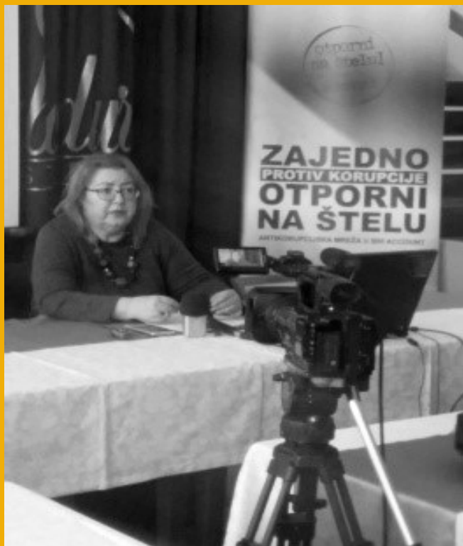
Press konferencija Zenica

Helsinški odbor za ljudska prava je u okviru projekta „ Jednake šanse – transparentnost u zapošljavanju u javnom sektoru III “ u prethodnom periodu izradio Analizu zakonodavnog okvira u oblasti zapošljavanja u javnom sektoru u ukupno sedam kantona u BiH ( Posavski, Bosansko-podrinjski, Tuzlanski, Srednjo-bosanski, Zeničko-dobojski, Unsko-sanski kanton i Kanton 10 ). U cilju prezentovanja nalaza analize održane su konferencije za medije u navedenim kantonima tokom septembra. Konferencijama su prisustvovali predstavnici kantonalnih timova za borbu protiv korupcije, organizacija civilnog društva, medija i predstavnici lokalnih vlasti.