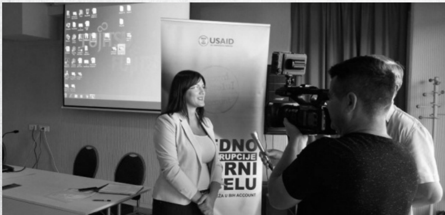
Orašje, 10.septembar 2018