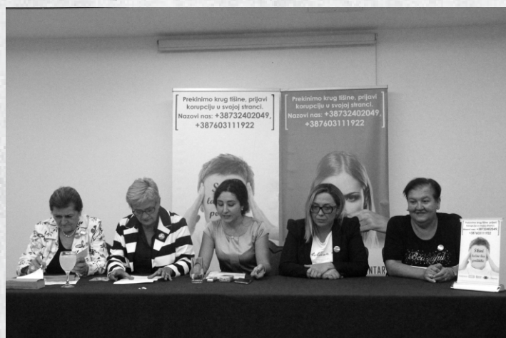
Press konferencija #skinilaznolicepolitike u Sarajevu

Inicijativu za besplatnu pravnu pomoć kandidatkinjama na izborima 2018. godine provode Fondacija INFOHOUSE, Fondacija CURE, Centar ženskih prava i Udruženje građanki Grahovo.