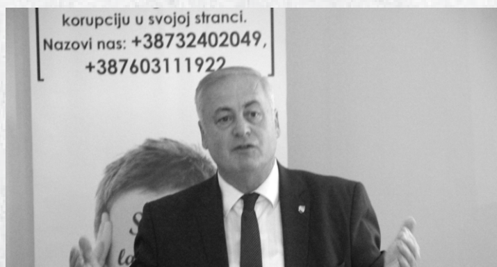
(Treninzi u Tuzli, Sarajevu, Banjaluci)