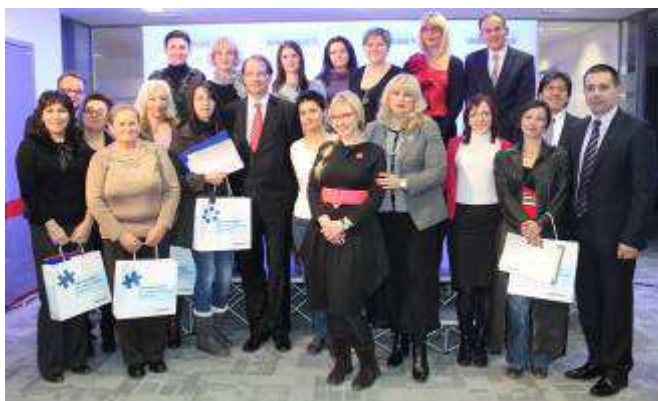
Foto: Dodjela nagrada korisnicama projekta u zgradi Sparkasse banke

Tokom 2012. godine, kao vlastiti doprinos društvenoj zajednici, bez ikakve finansijske i donatorske potpore Udruženje INFOHOUSE i Fondacija CURE pokrenule su INTERVENTNI FOND ZA ŽENSKO PODUZETNIŠTVO 2012. Na Javni poziv objavljen 30.06.2012. godine pristiglo je nešto manje od 300 aplikacija nezaposlenih žena, sa fenomenalnim idejama za pokretanje vlastitih malih biznisa. U Fond je prikupljeno ukupno 21.550,00 KM i to zahvaljujući donacijama SPARKASSE BANK, Općine Novi grad Sarajevo, Menproma dd Tuzla, Udruženja Srebrenice 99. Misija OSCE u BiH također je dala podršku ovoj inicijativi. U skladu sa ukupnim iznosom prikupljenih sredstava, članovi/ce Komisije za odabir najboljih biznis planova izdvojili su ukupno 15 projekata čija realizacija će biti podržana sredstvima iz Fonda. Sparkasse bank priredila je za sve dobitnice sredstava i Novogodišnju večeru na kojoj je osim dobitnica sredstva, predstavnika INFOHOUSE-a i Fondacije CURE prisustvovala i uprava Sparkasse bank, na čelu sa Savom Dalbokom, predsjednikom NO Sparkasse bank. Ovaj projekt je u periodu realizacije imao preko 150 javnih medijskih nastupa na različitim televizijskim kućama, radio stanicama, u različitim štampanim medijima, agencijama i web portalima. Za ovaj projekat nije postojala finansijska osnova donatora za angažman Udruženja INFOHOUSE i Fondacije CURE već su sva prikupljena sredstva upotrebljena za projekte nezaposlenih žena.