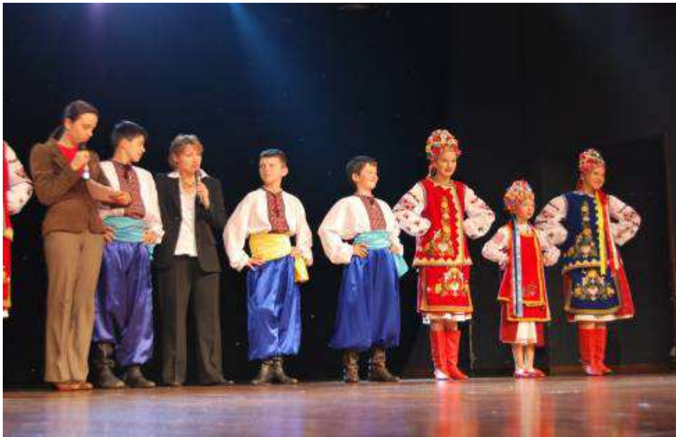
Foto: detalj sa ceremonije

Medijska promocija organizovanja manifestacije „OD MULTIKULTURALIZMA DO INTERKULTURALIZMA UZ INKLUZIVNO I INTERKULTURALNO OBRAZOVANJE U BIH“ počela je 25.05.2012. godine, Ukupno je objavljeno 30 priloga od strane 25 različitih medija koji obuhvataju cjelokupnu teritoriju BiH.