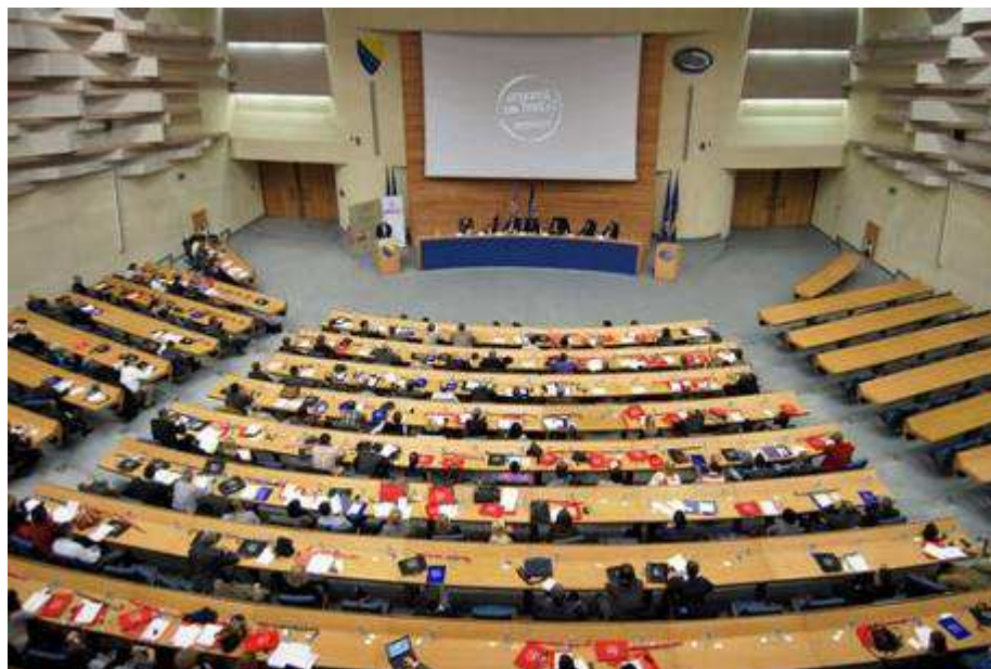
Foto: detalj sa Osnivačke skupštine Mreže ACCOUNT

Success story: Nijedna mreža u Bosni i Hercegovini do sada nije ujedinila 93 članice (NVO organizacije, vladine institucije, medije i građane) u zajedničku borbu protiv istog problema- KORUPCIJE kao što je to učinio ACCOUNT.