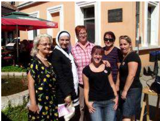
Foto: detalji sa ulične akcije

Podršku projektu pružio CCI u vrijednosti od 33.349,94 USD.