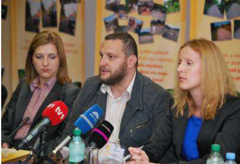
Foto: detalj sa pres konferencije

Success story: Dana 11.10.2012. u Sarajevu su predstavljeni rezultati osam projekata romskih udruženja realizovanih u okviru programa 'Podrška implementaciji nacionalnih akcionih planova za uključenje Roma'. Nosio realizacije osam projekata bili su humanitarna organizacija 'Care international' i Euro Rom iz Tuzle. EU je za ovu svrhu uložila 500.000 EUR, a ni pomoć lokalne samouprave BiH nije zaostala, te se pet općina ovaj put uključilo sa donacijom od 35.000 KM.