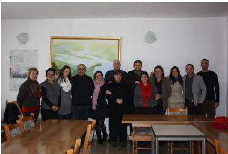
Foto: detalj sa radionice za Caritas