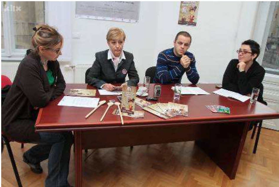
Fotografija sa konferencije za novinare prilikom koje je pormovirano istraživanje

http://www.infohouse.ba/doc/101%20razlog%20-%20izvjestaj%20istrazivanje%20medija.pdf